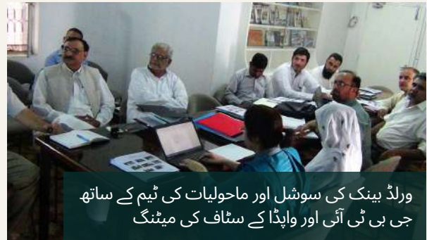
ورلڈ بینک کی سوشل اور ماحولیات کی ٹیم کے ساتھ جی بی ٹی آئی اور واپڈا کے سٹاف کی میٹنگ