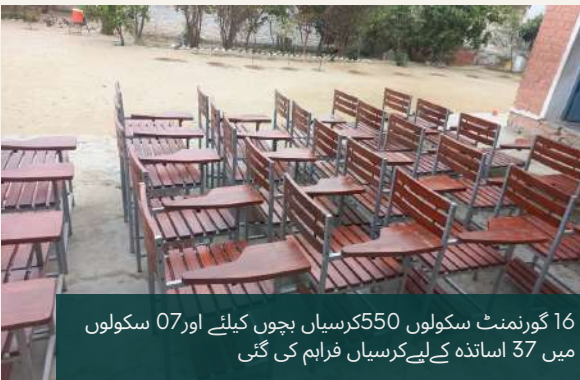
16 گورنمنٹ سکولوں 550 کرسیاں بچوں کیلئے اور 07 سکولوں میں 37 اسانڈہ کیلئے کرسیاں فراہم کی گئی