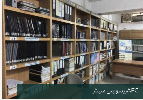
AFC ریسورس سینٹر