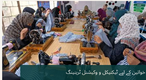
خواتین کے لیے ٹیکنیکل و وکیشنل ٹرینینگ