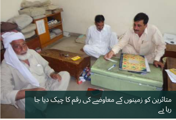
متاثرین کو زمینوں کے معاوضے کی رقم کا چیک دیا جا رہا ہے