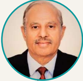
جناب مادی علی خان سابق وفاقی سیکریٹری