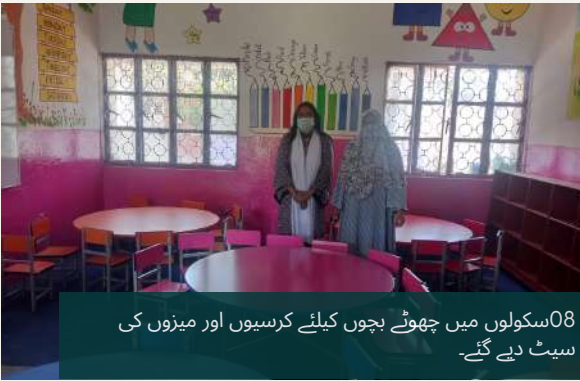
08 سکولوں میں چھوٹے بچوں کیلئے کرسیوں اور میزوں کی سیٹ دیے گئے۔

بچوں کی ابتدائی تعلیم و تربیت کے پروگرام کا مقصد جی بی ٹی پانچ پی سے متاثرہ علاقے میں تین سے پانچ سال کے بچوں کے 100 فیصد داخلے کو یقینی بنانا ہے۔ اس پروگرام کے تحت ابتدائی طور پر 32 دیہی علاقے جہاں جی بی ٹی آئی کی تنظیمات ترقیاتی کاموں میں سرگرم عمل ہیں کا انتخاب کیا گیا۔ اس سال 06 علاقوں کا انتخاب کیا گیا جہاں بچوں کی ابتدائی تعلیم و تربیت کے سنٹر زکھولے جائیں گئے۔ فعال کارکنان کو ECE سینٹر کے قیام کے لئے دی گئی خدمات کے عوض اعزاز بہدیا جاتا ہے۔ جی بی ٹی آئی اور فعال کارکن کے مابین معاہدہ دستخط کرنے کے بعد ادارے نے مقامی تنظیمات کے ساتھ ملکر ضلع اٹک، ہری پور، صوابی اور ایبٹ آباد میں کل ملا کر 44 سینٹر قائم کئے گئے۔ جن میں سے 32 سینٹر فعال ہیں اور دیے گئے مینول کے مطابق اور بچوں کی تعلیم و تربیت میں اپنا کردار ادا کر رہے ہیں۔ اسی سلسلے میں CRPs کی تعارفی ورکشاپ کا بھی انعقاد کیا گیا۔ اس کے بعد 32 ٹیچرز کو ECE کورس سے متعلق چار روزہ تربیت دی گئی۔ ان 32 ECE سینٹرز میں جون 2024 تک 564 بچوں نے داخلہ لیا۔ ادارہ جی بی ٹی آئی کی طرف سے ان سینٹرز میں بچوں کے لئے کھلونے، چارٹ، ٹیچرز کے لئے کرسی میز، بچوں کے بیٹھنے کے لئے قالین اور دیگر ضروری سامان فراہم کیا گیا جسکی مالیت 30,000 سے 50,000 فی سینٹر ہے۔