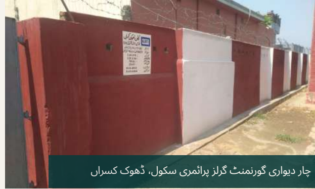
چار دیواری گورنمنٹ گرلز پرائمری سکول، ڈھوک کسراں