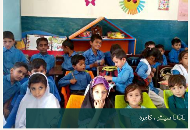
ECE سینٹر ، کامرہ