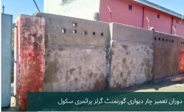
دوران تعمیر چار دیواری گورنمنٹ گرلز پرائمری سکول