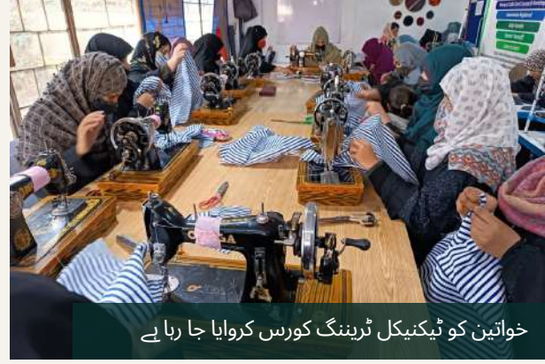
خواتین کو ٹیکنیکل ٹریننگ کورس کروایا جا رہا ہے