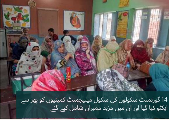
14 گورنمنٹ سکولوں کی سکول مینیجمنٹ کمیٹیوں کو بھر سے ایکٹو کیا گیا اور ان میں مزید ممبران شامل کیے گئے