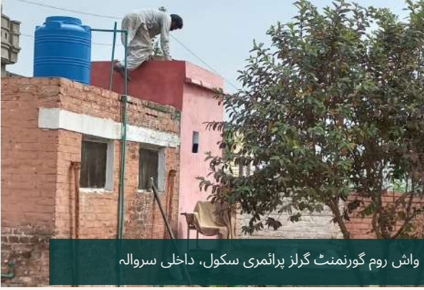
واش روم گورنمنٹ گرلز پرائمری سکول، داخلی سروالہ