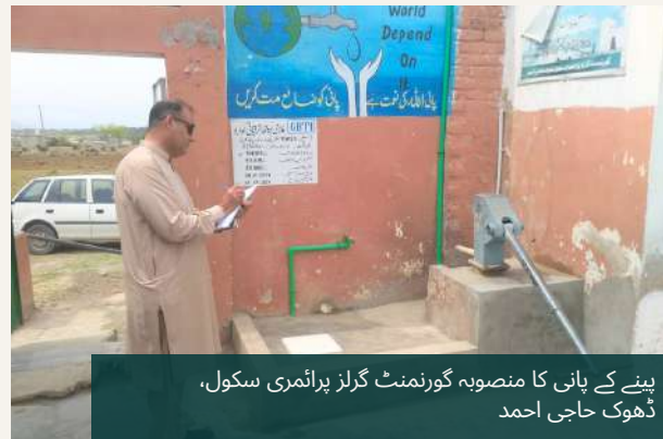
پینے کے پانی کا منصوبہ گورنمنٹ گرلز پرائمری سکول، ڈھوک حاجی احمد