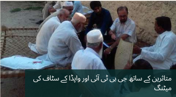
متاثرین کے ساتھ جی بی ٹی آئی اور واپڈا کے سٹاف کی میٹنگ

30,681 متاثرین کو 4,411.55 ملین روپے ادا کروا چکا ہے جو کہ کل ایوارڈ رقم کا 97% بنتا ہے۔ متاثرین معاونتی سیل پنجاب کے متاثرین کا اہم مسئلہ نہر کے کناروں کی بقیہ زمین سپائل بنکس کی فروخت کے حوالے سے جی بی ٹی واپڈا کے ساتھ مل کر کوشش کر رہا ہے تاکہ پنجاب میں سپائل بنکس کی فروخت کا عمل جلد از جلد شروع کیا جائے مگر تاحال پنجاب بورڈ آف ریونیو کی طرف سے این اوسی جاری نہیں کیا گیا جبکہ خیبر پختونخواہ میں تمام سپائل بنکس فروخت کئے جاسکے ہیں۔ اس کے علاوہ تاحال جن متاثرین کو ابھی تک پلاٹ نہیں الاٹ کیے گئے اس سلسلے میں بھی متاثرین معاونتی واپڈا کو متعدد بار بذریعہ خط آگاہ کر چکا ہے تاکہ متاثرین کو جلد از جلد پلاٹ الاٹ کیے جاسکیں۔