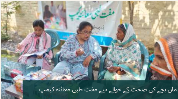
ماں بچے کی صحت کے حوالے سے مفت طبی معائنہ کیمر

بلاسود قرض کے پروگرام کو وسعت دینے، اس کے حجم اور معیار کو برقرار رکھنے کیلئے ضرورت اس امر کی تھی کہ لوگوں کو محلے اور گاؤں کی سطح پر منظم کیا جائے جو کہ سماجی ضمانت کے ساتھ ساتھ ترقیاتی کاموں میں شرکت کریں۔ لیکن اس اہم کام کیلئے کسی قسم کی مالی معاونت نہ تھی جبکہ قرضہ پروگرام کا تجربہ یہ ظاہر کرتا ہے کہ ایسے پروگرام قدرتی اور انسانی نقصانات کیلئے بہت زیادہ حساس ہوتے ہیں مختلف سرگرمیوں اور پروگرام ایسے ہیں جن ذریعے خطرات کو کم کیا جاسکتا ہے۔ لہذا ایک نئے پروگرام "اپنی مدد آپ" کو تشکیل دیا گیا۔ جس کے ذریعے لوگوں میں آگاہی پیدا کی گئی کہ وہ منظم ہو کر اپنی بچت کے ذریعے ترقیاتی کاموں کا آغاز کریں تاکہ دوسرے سرکاری و غیر سرکاری ادارے بھی انکی معاونت کرنے کیلئے تیار ہو جائیں۔ پہلے مرحلے میں PPAF کے تعاون سے سرحد رول سپورٹ پروگرام کی تشکیل شدہ تہذیبیات اور تربیت یافتہ فعال کارکنان سے رابطہ کیا گیا اور ان تہذیبیات کو فعال کرنے کے ساتھ ساتھ نئی تہذیبیات کی تشکیل بھی عمل میں لائی گئی۔ ممبران و مخیر حضرات سے بچت / ترقیاتی کاموں کے لیے شراکتی حصہ لیا گیا تاکہ انکی صلاحیتوں کو بروئے کار لاتے ہوئے غریب گھرانوں کی آمدن میں اضافہ کیا جاسکے اور انھیں ترقیاتی عمل میں شامل کیا جاسکے۔ اس ضمن میں درج ذیل سرگرمیاں عمل میں لائی جا رہی ہیں: