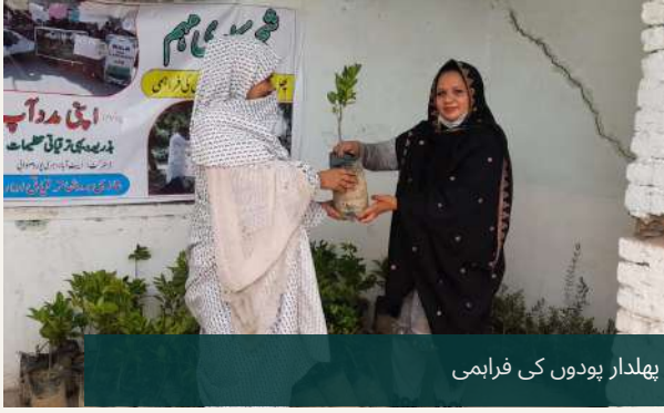
پھلدار پودوں کی فراہمی