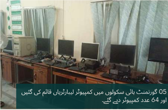
05 گورنمنٹ ہائی سکولوں میں کمپیوٹر لیبز قائم کی گئیں اور 64 عدد کمپیوٹر دیے گئے۔