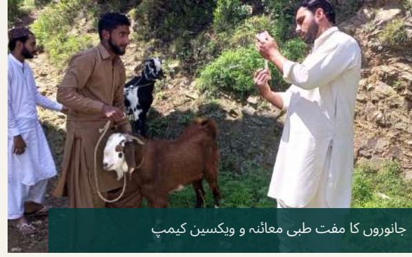
جانوروں کا مفت طبی معائنہ و ویکسین کیمر