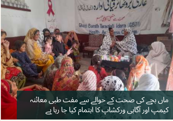
ماں بچے کی صحت کے حوالے سے مفت طبی معائنے کیمپ اور آگاہی ورکشاپ کا اہتمام کیا جا رہا ہے